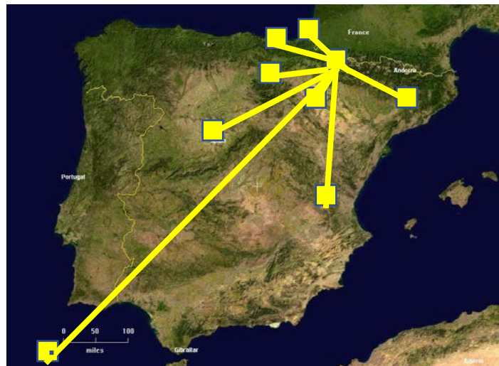
Dibujo 2: Representación de la red de pastores

NOTA: Este es un documento en su versión inicial. Os animo a que se propongan nuevas formas de participación y nuevos proyectos. De ser así, podremos entender que esta iniciativa está viva.